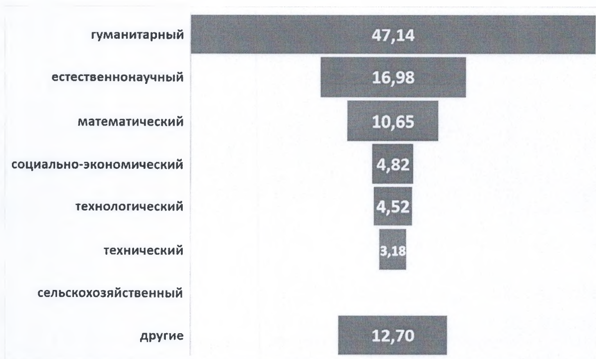
Рисунок 1. Структура учащихся основного общего образования с углубленным изучением отдельных предметов в 2021 году, %.

В то же время в классах с углубленным изучением отдельных предметов обучаются 36,1 тысяч человек, что составляет 17% от общего количества учащихся основного общего образования. При этом самыми востребованными направлениями являются гуманитарное (47,14%), естественнонаучное (16,98%) и математическое (10,65%) (рис. 1).